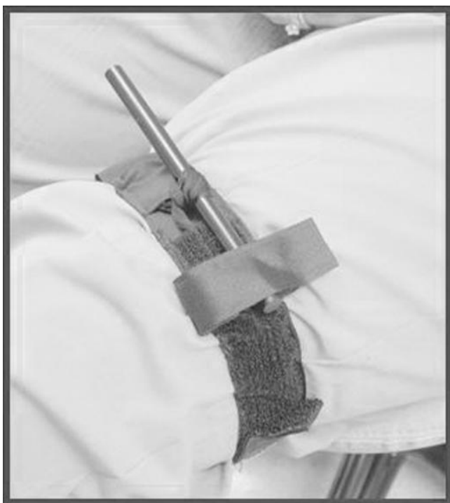
Рис. 2 Жгут "Combat Application Tourniquet (С-А-Т)", наложенный на нижнюю конечность

Службой здравоохранения Великобритании для практического использования в качестве жгута выбран С-А-Т - Combat Application Tourniquet (North American Rescue Products, Inc, USA) после того, как он показал 100% эффективность прекращения кровотока в дистальных отделах конечности при исследовании на добровольцах 16 . На рис.2 показано С-А-Т, наложенный на нижнюю конечность.